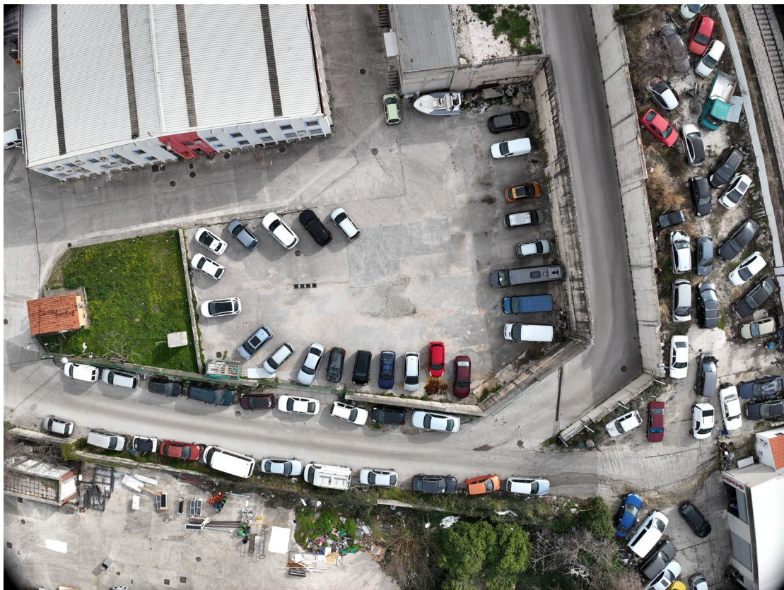
Slika 2. - Pogled iz zraka