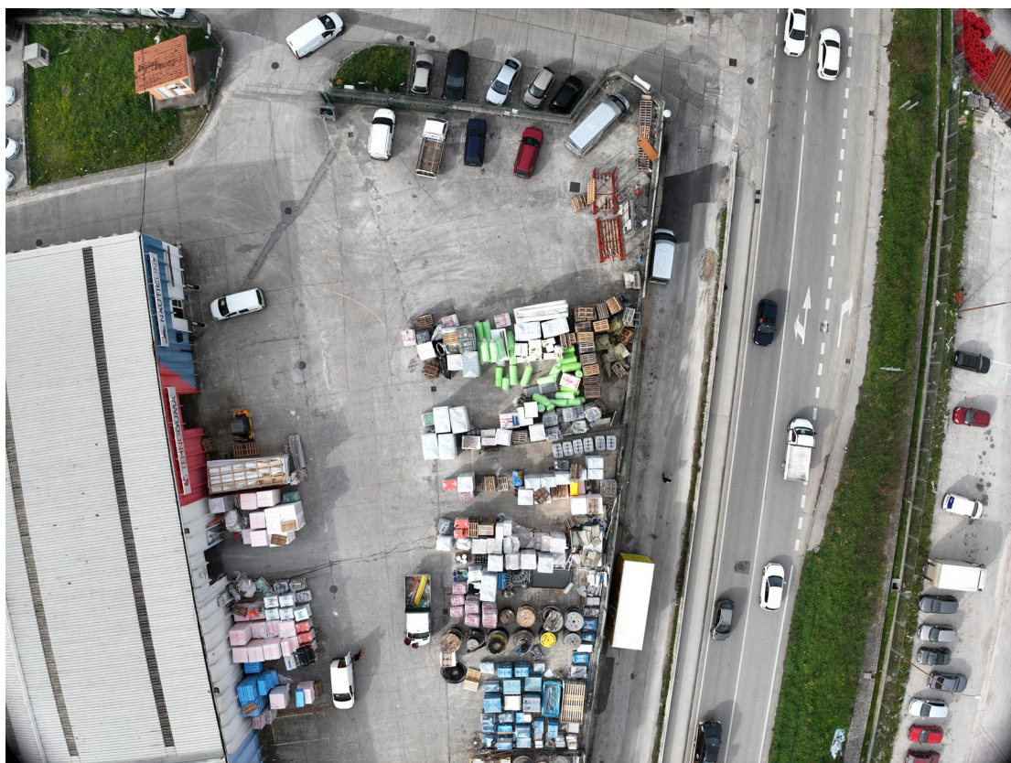
Slika 1. - Pogled iz zraka